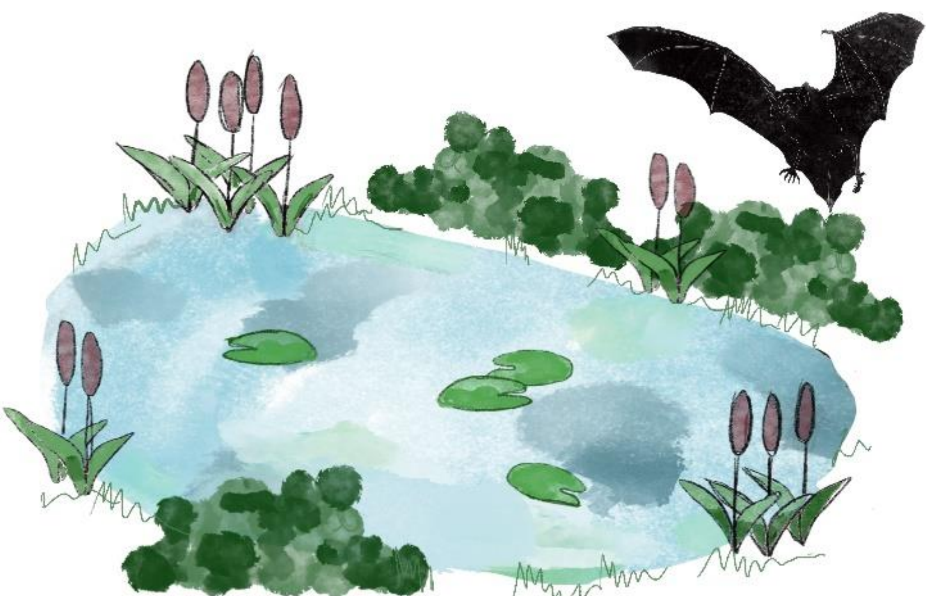
Wasserfledermaus (AT) Netopier vodný (SK)

Bratislava und Wien: Eine Besonderheit in Bratislava! Bekannte Quartiere liegen in verlassenem Gebäuden nahe dem Stadtwald. Generell in Städten kaum vorkommend, ausnahmsweise in Randbereichen, aber auch hier sehr selten.