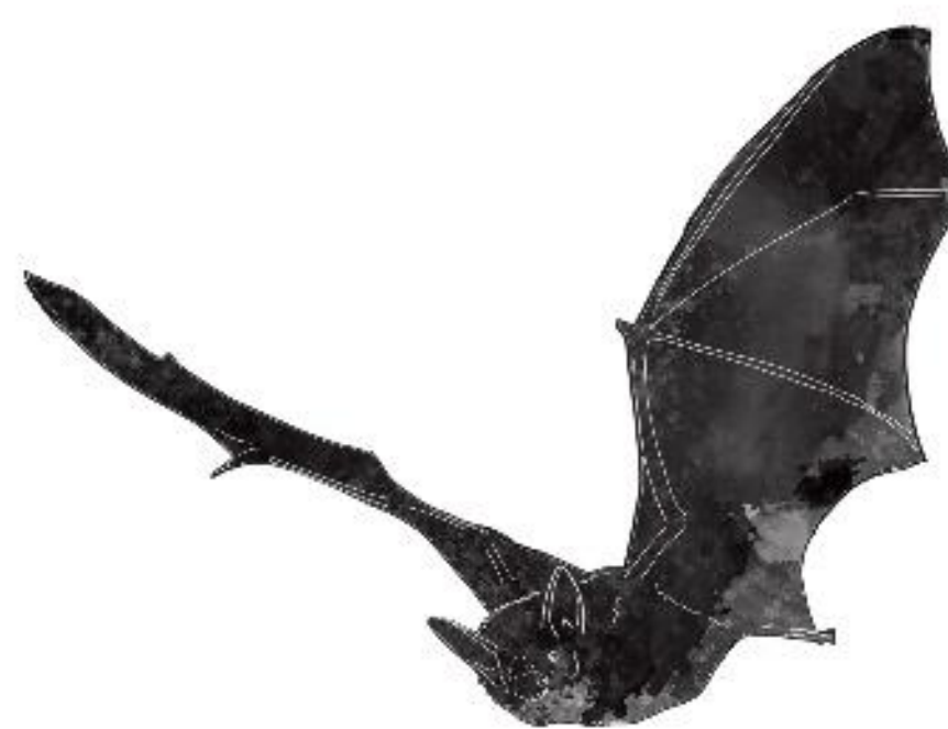
Mausohr (AT) Netopier obyčajný (SK)

Myotis myotis Eine der größten Fledermausarten in Europa, jagt bevorzugt Laufkäfer am Boden. Fliegt erst aus, wenn es dunkel ist, daher bitte keine Beleuchtung an Kirchen! Flügelspannweite: 40 cm; Gewicht: 20 - 40 g