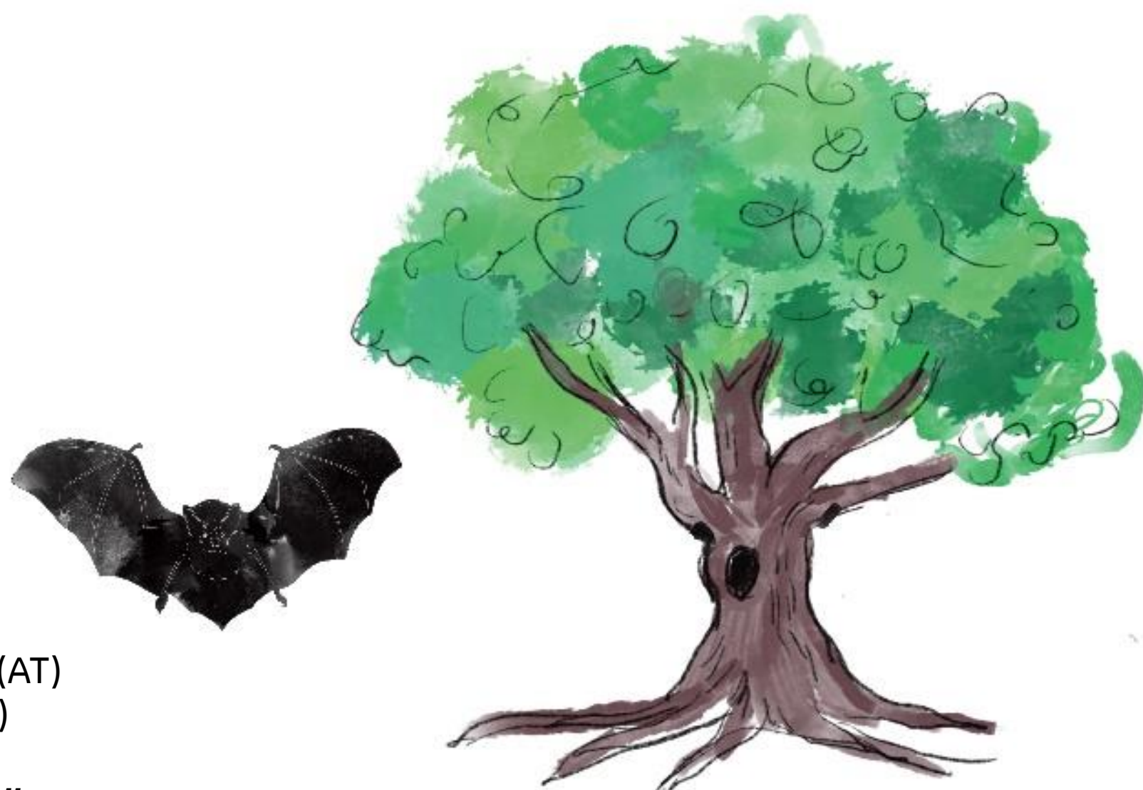
Zwergfledermaus (AT) Večernica malá (SK)

Bratislava und Wien: In Städten generell sehr selten und eine Besonderheit für Wien! Entdeckung eines Quartiers mit 90 Weibchen und 50 Jungtieren. Nachgewiesene Distanz zwischen Quartier und Jagdgebiet eines Individuums: 3 – 4 km Dies entspricht der Strecke vom Bahnhof Hütteldorf bis zum Hohenauer Teich im Lainzer Tiergarten